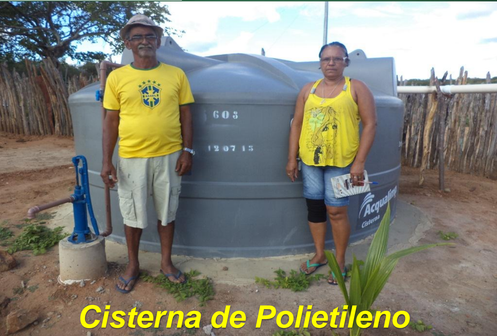
Cisterna de Polietileno