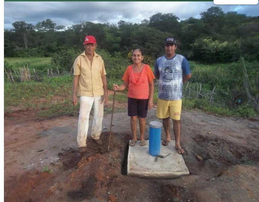
Laje de proteção do Poço construído em Riacho Verde, Parambu, CE